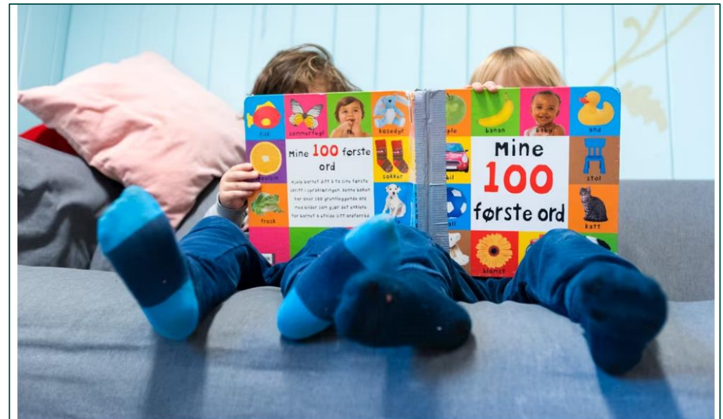
MINDRE LESELYST: Bare 13 prosent av norske barn oppgir at de liker å lese godt, noe som er langt under det internasjonale gjennomsnittet.