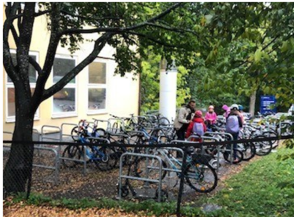
Syklistenes landsforening delte ut gratis sykkellykt til dagens syklister tirsdag 21. september

Både skolen og FAU er for tiden sterkt opptatt av trafikksituasjonen rundt Smestad skole. Særlig er det Nedre Smestadkryss og utkjøring av tungtrafikk på oversiden av ringveien som er i fokus, men også andre strekninger er mye trafikkert. Skolepatruljen er erstattet med foreldrevakter, og hipp hurra for det. Takk for innsatsen! Trygg Trafikk og SL hadde aksjon på en morgen i september,