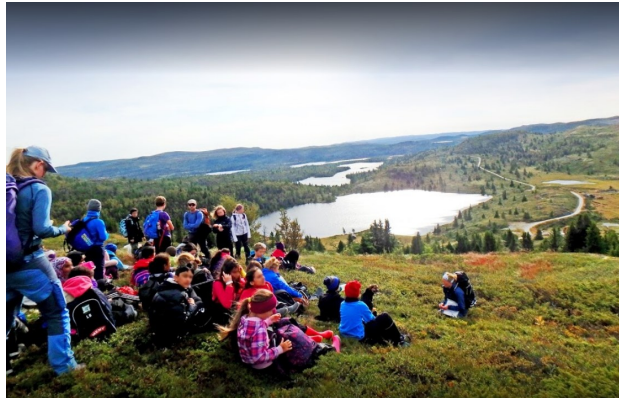
Stort sett flott vær i Hallingdal, som på bildet over

Et av årets høydepunkt på sjuendetrinn er leirskolen til Hallingdal leirskole i Ål. I uke 37 forlot elevene tårevåte foresatte på Smestad, og satte kurs for en herlig uke på fjellet, i mobilfrie og vakre omgivelser. Fine turer, spennende overnattinger på hytter, middag i felles matsal og mange andre aktiviteter gir opplevelser som de fleste av våre elever