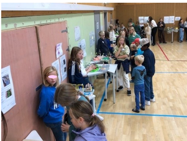
6. trinn viser stolt fram sine rapporter og modeller

I uke 38 og 39 har alle elevene på Smestad skole jobbet med prosjektet Nye Smestad. Skolen har i samarbeid med Oslobygg og Utdanningstaten ønsket å få elevene selv i tale når det gjelder utformingen av uteområdene for Nye Smestad skole. Elevene har kastet seg over problemstillingen, laget undersøkelser og modeller, forsket og fundert, og kommet med diverse forslag. På torsdag før