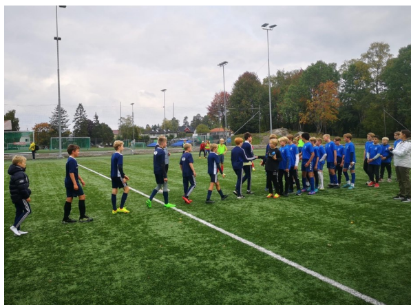
Det er god skikk å takke for kampen