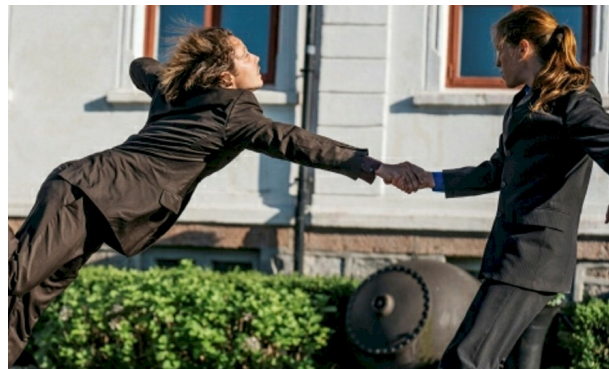
Holde fast? Slippe løs? Mye å lure på!

En haug med første- og andreklassinger, to dressklede utøvere i en absurd performance, en sliten gymsal... Høres ut som oppskrift på kaos? Neida, forestillingen «Bak lukkede dører» i gymsalen i midten av oktober fungerte godt for våre minste elever, som fulgte spent med og var med på notene. Den kulturelle skolesekken serverer oss mange forskjellige kulturinntrykk i løpet av et skoleår.