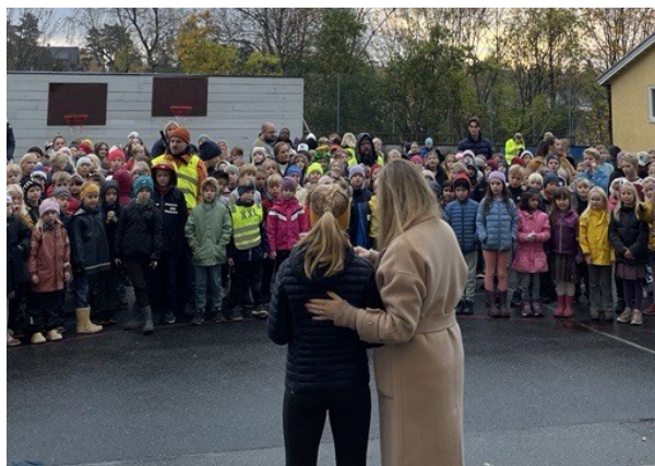
Elevrådsleder foran hele skolen

Årets skolejogg ble gjennomført mandag 24.10, på selve FN-dagen. I år valgte skolen å løpe for Leger uten grenser, på dagen etter TV-aksjonen for samme organisasjon. Vi startet med felles oppmøte og allsang i skolegården, med flott appell fra elevrådsleder. Til tross for litt yr i luften var det godt engasjement i løypa fra Smestad skole til Frognerparken. Fore-