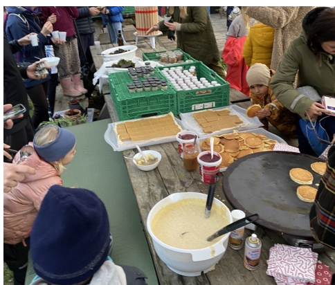
Alle er enige om at høsttakkefest blir en årlig hendelse på Smestad

Det var stort oppmøte og god stemning på høsttakkefest i skolehagen fredag 14. oktober. Grønnsakssuppe og lapper gikk ned på høykant, og foresatte kunne kjøpe litt grønnsaker, plantenering og diverse, lokalprodusert selvsgt. Overskuddet går i sin helhet til frø