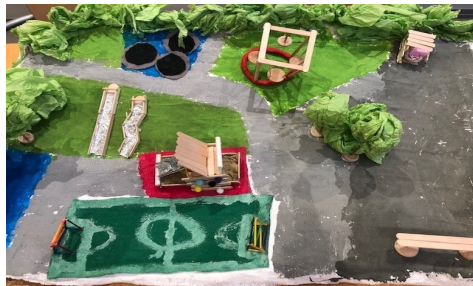
Flere elevmodeller ble vist fram på møtet

Torsdag 13. oktober ble det første åpne informasjonsmøtet om Nye Smestad skole avholdt på skolen. Det var Oslobygg som sto for møtet, og tilstede var representanter for Oslobygg, Utdanningsetaten, Norconsult, Enerhaugen arkitektbyrå, og Plan- og bygningsetaten. Målet for møtet var å informere om at de første formelle