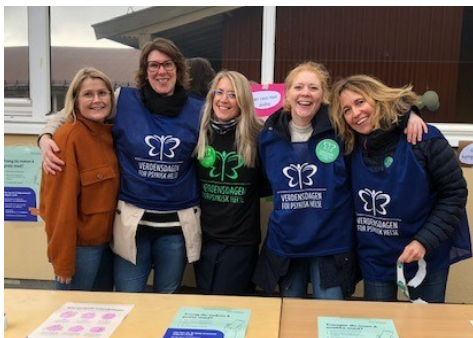
Spørsmål om psykisk helse? Snakk gjerne med oss!

Vi markerte Verdensdagen for psykisk helse fredag 14. oktober, med musikk i skolegården, trivselsmeldinger på veggene, og mange gode smil.