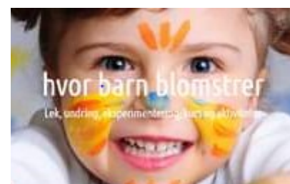
hvor barn blomstrer Lek, undring, eksperiment, utforsking og uttrykk