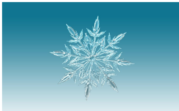
Snøen daler på Det Norske Teatret

Sjette-trinn fikk oppleve Det Norske Teatret nå i november, når DKS inviterte trinnet på forestillingen Snøsøstera. Snøsøstera er en fortelling om vennskap, søskenkjærighet, familiesamhold, og om å akseptere den nådeløse døden som truer enhver lykke. Sterkt budskap, og en flott forestilling. Med salen full av sjetteklassing-er var det høyt lydnivå, men Smestadbar-na var eksemplariske! Forestillingen er basert på boka av Maja Lunde og illustratør Lisa Aisato.