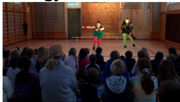
Det kan bli ganske så spennende når gymsalen blir en scene!

Elevarrangørene våre kunne på nytt invitere til DKS-forestilling i gymsalen nå i januar. Småtrinnet fikk oppleve en eventyrlig danseforestilling med saftige hallingspark og saftig felespill! Takk for opplevelsen!