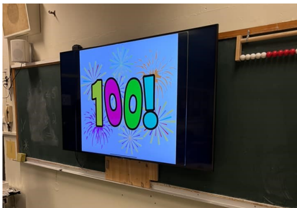
Hundredagersfeiring med tre siffer og et utropstegn!

2023 er godt i gang for alle elevene på Smestad skole, og nå er også de første 100 dagene over for skolestarterne våre. 25. januar gikk det rett og slett i 100 for hundreåringene på første trinn. Dagen ble feiret med oppfordring til å kle seg som en 100-åring, og det var derfor mange grå hår og skaut å se i ganger og