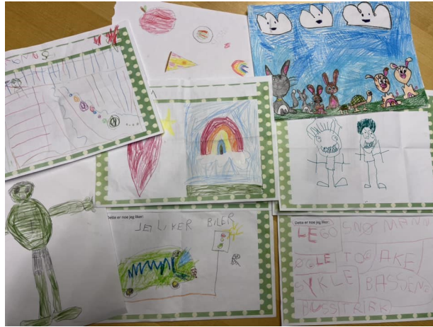
Mon tro om vi finner igjen tegningen vår i august?

Onsdag 18. januar fikk Smestad skole hyggelig besøk fra våre kommende førsteklassinger. Dette var det første møte med skolen for mange av våre skolestartere til høsten. De leverte en tegning med noen de liker, besøkte vårt flotte bibliotek og gjorde noen aktiviteter i et par klasserom. Smestad har pr i dag 96 elever på listen for skolestart. Vi gleder oss til å ta imot alle