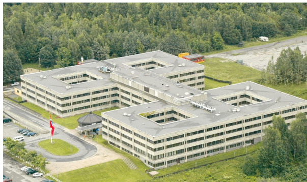
FO-bygget på Huseby vil være mulige erstatningslokaler for Smestad skole i perioden 2027-29

Vi lover rask informasjon når endelig bestemmelse kommer!