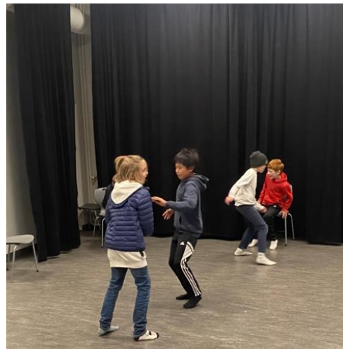
5D jobber på gulvet i dramarommet (Filmsalen)