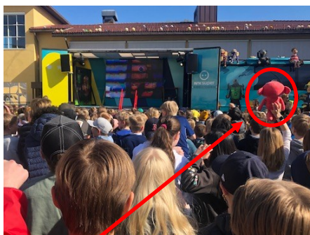
... men liten tvil om at det er Fantorangen som er heltene...