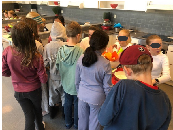
Mange samlet seg foran kakeloddsalget i 6A...

Det går bokstavelig talt varmt unna på skolekjøkkenet for tiden. Elevene på 6. trinn baker og selger kaker og andre slikkier til ivrige medelever fra andre klassetrinn. Sjette trinnselevene har jobbet med sine elevbedrifter i noen tid, fått godkjenning og salgstillatelse, og har drevet markedsføring av sine produkter. Kreativiteten har vært stor! Og nå er det salg det gjelder, til glede for mange kakespisende medelever.