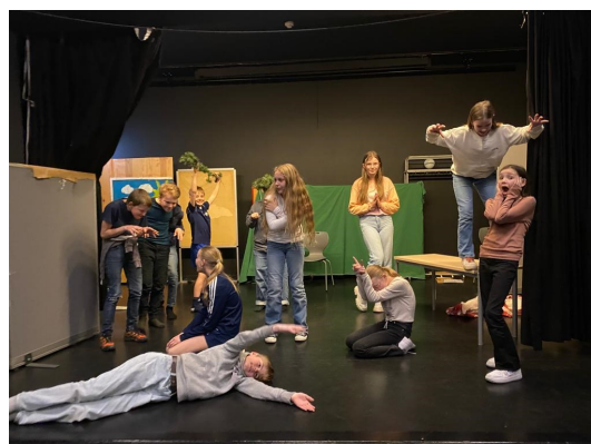
Tablåvisning med 6B på scenen

faget - som ser på individet fysisk, psykisk, åndelig og sosialt. Dette passer som hånd i hanske til ny læreplan, der livsmestring er et sentralt begrep.