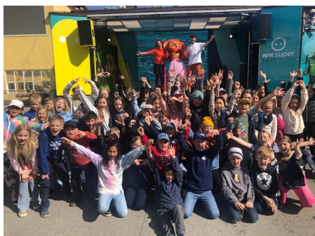
Alle klassene fikk ta klassebilde av heltene fra NrK Super

en hel uke?? (Og en til foreldrene: is på mandag—som jo er 1. mai...) Takk til Fantorangen og co for veldig hyggelig besøk!