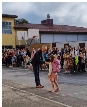
Solen skinner alltid på Smestad skole...

Første ordinære skoledag er i gang, og vi har ønsket både nye og "gamle" elever velkommen til Smestad. Mange klasser har fått nye medelever og/eller lærere, og det er alltid mye nytt. La oss sette i gang!