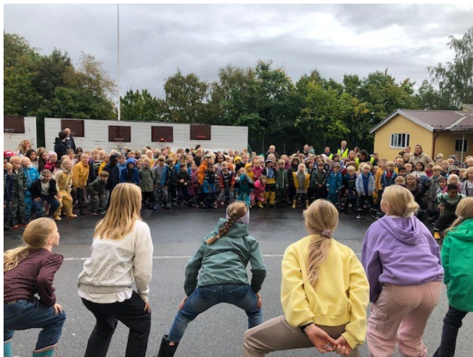
Moro med felles dans! Femte-trinnsjentene var fordansere for de yngre elevene når 1-5 danset årets Blime-dans sammen 22. september.