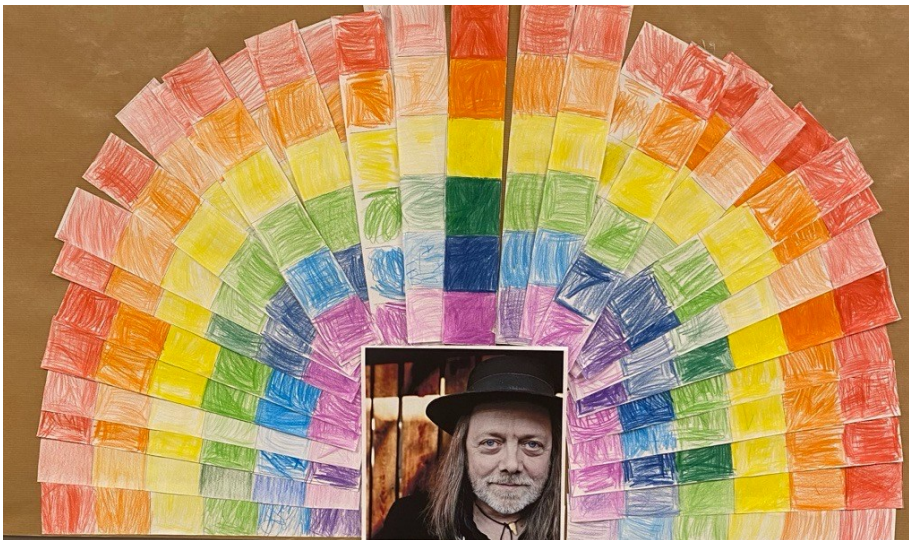
Barn av regnbuen - slik førstetrinn tolker det!

Det er ikke mange som kan smykke seg med tittelen Oslopoet slik som Lillebjørn Nilsen kan. Derfor laget vi vår egen uke på Smestad, der elevene sang Lillebjørn Nilsen-sanger, og kanskje ble litt bedre kjent med den folkekjære visesangeren som gikk bort i vår. Vi har sunget sanger,