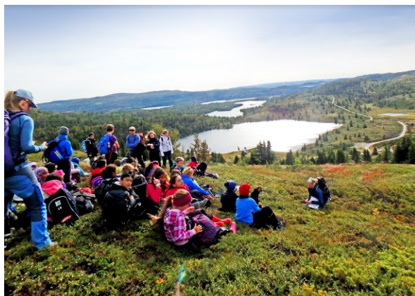
Nydelig høstdag i Hallingdal

Høstens vakreste eventyr er uten tvil leirskolen til Ål i Hallingdal, i hvert fall hvis du går i 7. klasse på Smestad skole. Årets leirskole ble gjennomført i Ål i Hallingdal i uke 37.